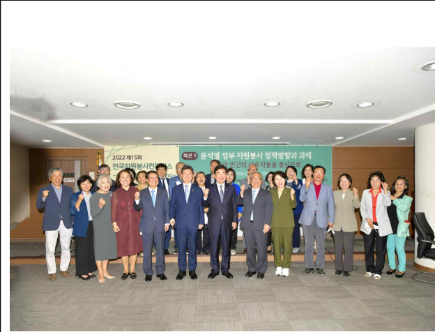
섹션1 대표자 단체사진