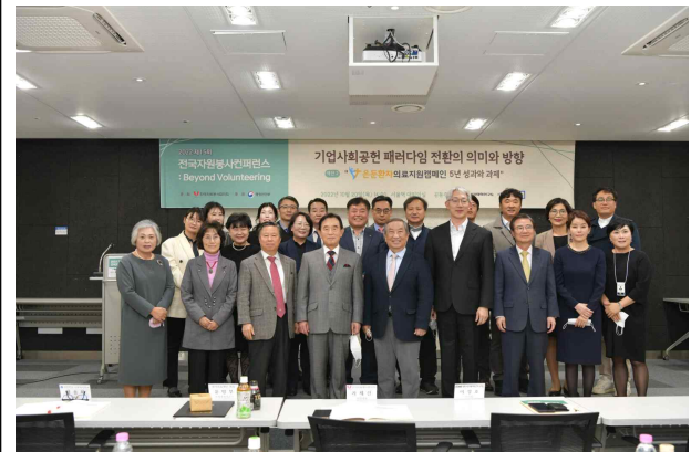
섹션2 대표자 단체사진