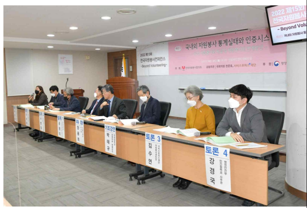
섹션3 기조강연, 발제, 토론