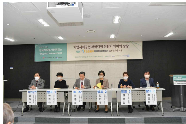
섹션2 기조강연, 발제, 토론