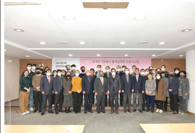
섹션3 대표자 단체사진